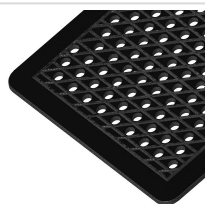
Vision Express Grill